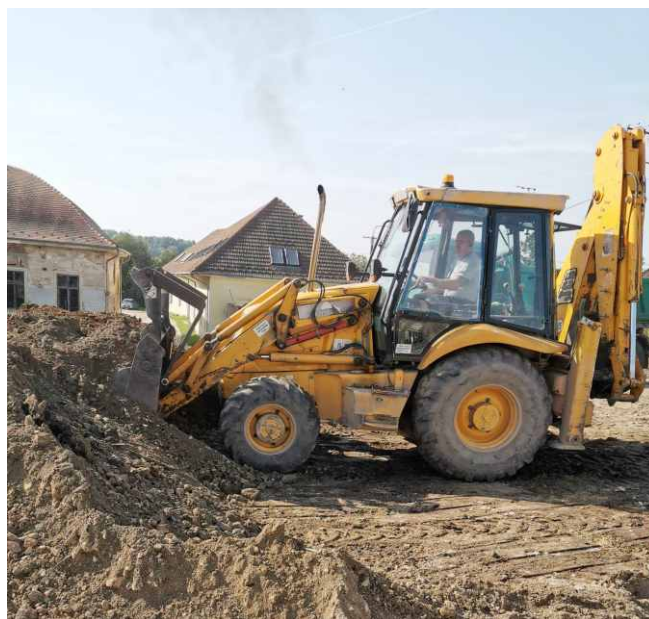
Kép és szöveg: PVK

Mindezen feladatokat a települési közösségünk komfortjének növeléséért, környezetünk kulturáltabbá tételéért tesszük. S azt szeretnénk, ha a lakosok nemcsak a hiányosságokat vennék észre, hanem az általunk elvégzett munka hasznosságát is, és együtt munkálkodhatnánk közös életterünkért.