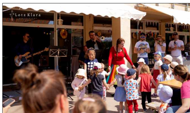
Gyereknep a Bellandor Lovasközpontban