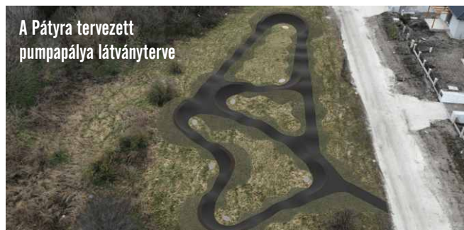
A Pátyra tervezett pumpapálya látványterve

Az Aktív Magyarország Program végrehajtásának érdekében létrehozott Aktív- és Ökoturisztikai Fejlesztési Központ arról értesítette Páty Község Önkormányzatát, hogy a település által 185 méter hosszú pumpapálya építésére beadott pályázat támogatást nyert. A pumpapálya egy aszfalt burkolattal ellátott hullámelemből és kanyarokból álló körpálya. A projekt tartalmazza a tervezett pálya megépítését, 3 db pad és 2 db szemetes telepítését, a pályavilágítás kialakítását, az ivóvíz bevezetését a telekre, egy ivókút kialakítását, információs táblák elhelyezését és a pálya közvetlen környezetének tereprendezését, parkosítását is.