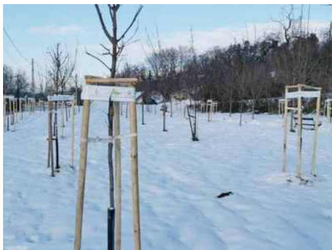
Dr. Bencze Gergő János – alpolgármester

A Településfásítási Programot az Országfásítási Program részeként 2019-ben hirdette meg az Agrárminisztérium, amelynek célja a vidéki települések zöldítése és környezeti állapotának javítása. A program keretében az őszi folyamán 345 településén nyolcezer fát ültetettek el.