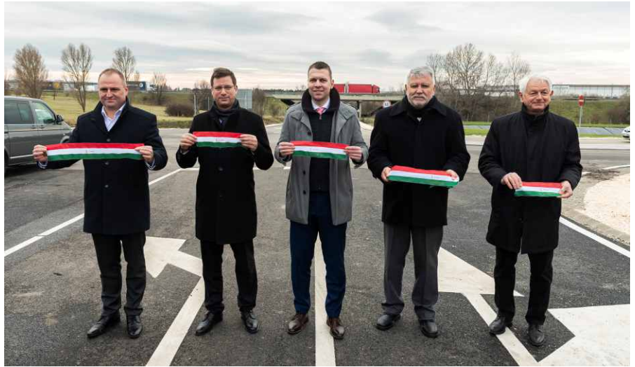
Pántya József, Gulyás Gergely, Menczer Tamás, Székely László, Tarjáni István

Menczer Tamás, a Külgazdasági és Külügyminisztérium kétoldalú kapcsolatokért felelős államtitkárának és a térség, Pest vármegye 2. számú választókerületének Fidesz-KDNP-s országgyűlési képviselője mindvégig támogatta a beruházást. Elmondta, hogy már képviselőjelölt-