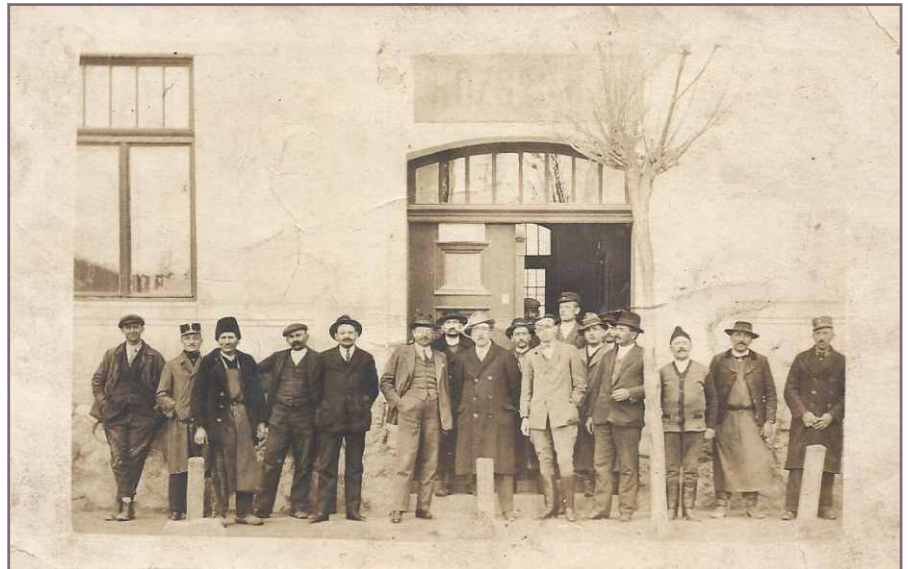
A községháza dolgozói 1930 végén.