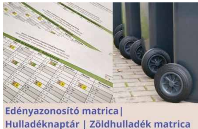
Edényazonosító matrica | Hulladéknaptár | Zöldhulladék matrica

Egyéb kérdés esetén elérhetőségeink állunk szíves rendelkezésükre. Megértésüket köszönjük!