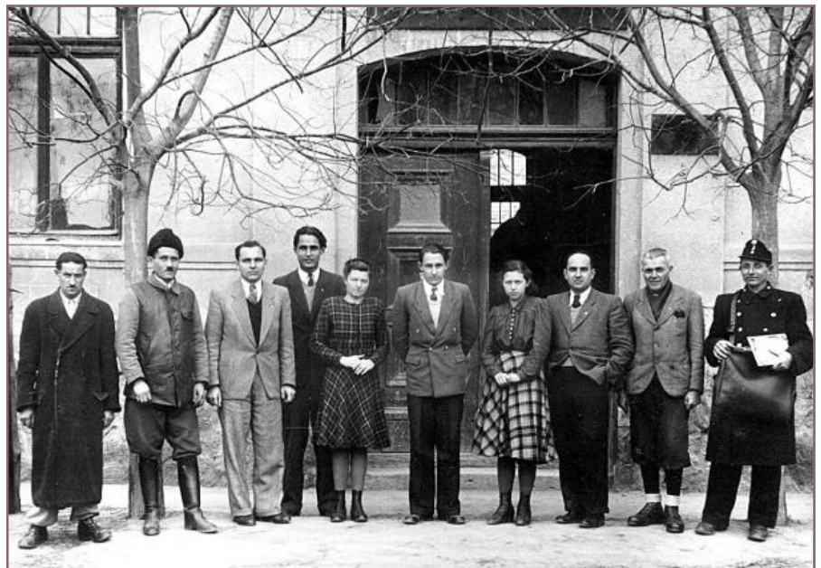
A községháza dolgozói 1949-ben.