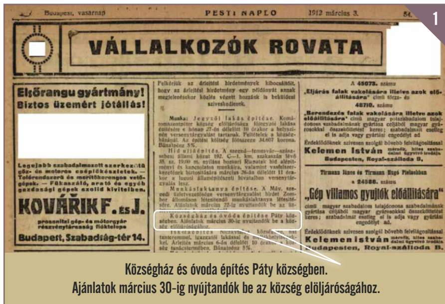
Községház és óvoda építés Páty községben. Ajánlatok március 30-ig nyújthatók be az község előljáróságához.