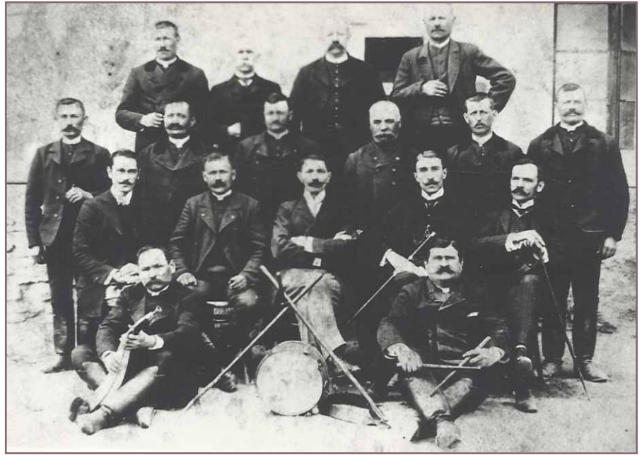
A községháza elöljárói 1900 elején.

Az óvoda épülete folytatólagosan épült az északnyugati szárny vonalában, beékelődve a két épülettömb közé egy kovácsoltvas kapuval.