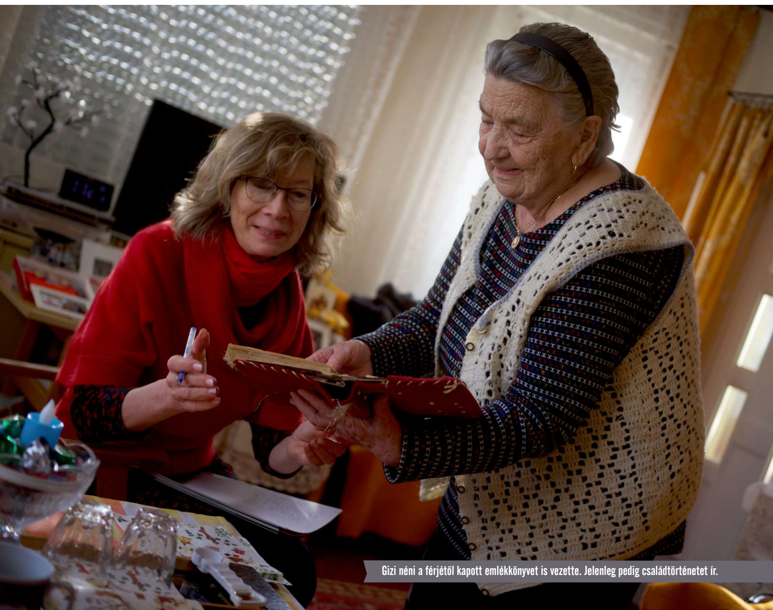
Gizi néni a férjétől kapott emlékkönyvet is vezette. Jelenleg pedig családtörténetet ír.