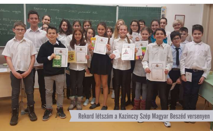
Rekord létszám a Kazinczy Szép Magyar Beszéd versenyen